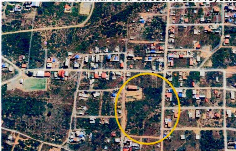
Vista Satelital de la Ubicación del Proyecto